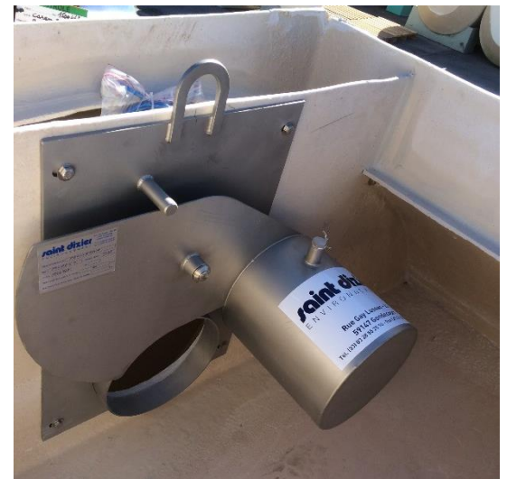
Régulateur de débit intégré