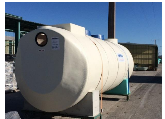
Ouvrage CAREN® en attente de livraison